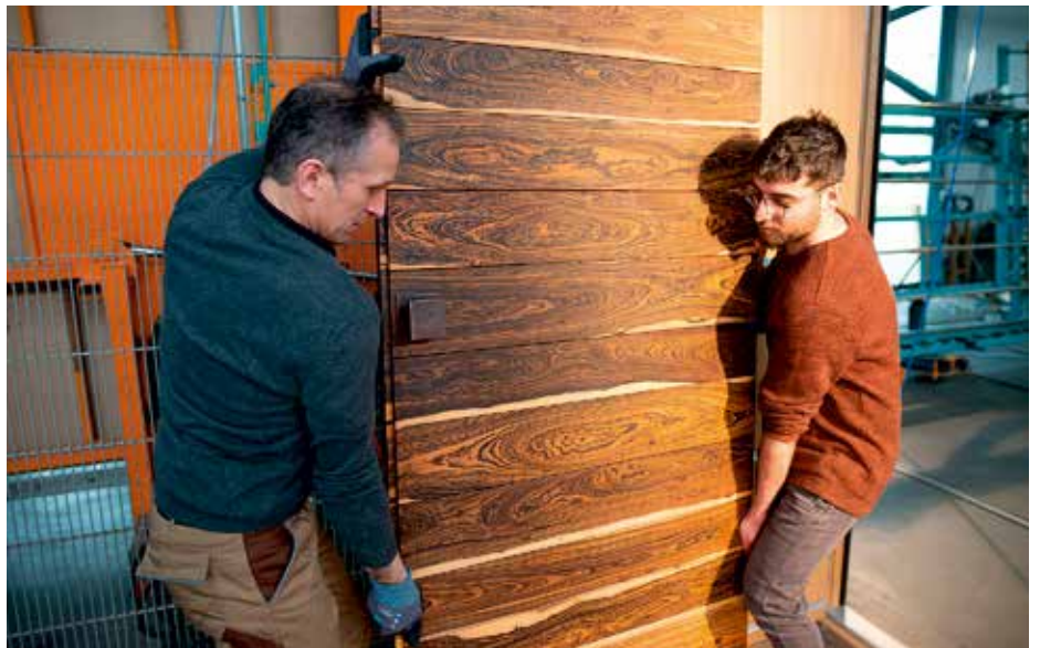
Ausgewählte Materialien, fachliche Präzision und sorgfältigste Bearbeitung machen jede Fenne zu einem ausdrucksstarken Unikat.