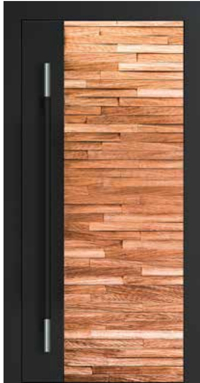
Mit Axt und Fingerspitzengefühl entsteht dieses FENNEN-Modell aus Spalteiche.

Mittlerweile steht die FENNEN-Welt auf drei Designsäulen. In den sogenannten Designwelten werden Modelle mit grundlegenden Gemeinsamkeiten zusammengefasst. In der Designwelt Exoten & Handwerk trifft man auf Modelle aus exklusiven Klanghölzern wie dem wunderbar lebendigen Bocote. Aber auch detailliert gearbeitete Fronten mit dreidimensionalen Strukturen wissen zu beeindrucken, wie beispielsweise bei dem Modell Loken 1.0 mit Profilen aus dem Holz der Marone, die mit unterschiedlichen Tiefen und Breiten wie zufällig angeordnet wirken.