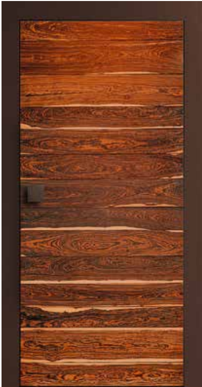
Das Klangholz Bocote beeindruckt mit sehr lebendiger, ausdrucksstarker Maserung.

das ist auch sein Antrieb, immer wieder neue außergewöhnliche Designideen zu entwickeln.